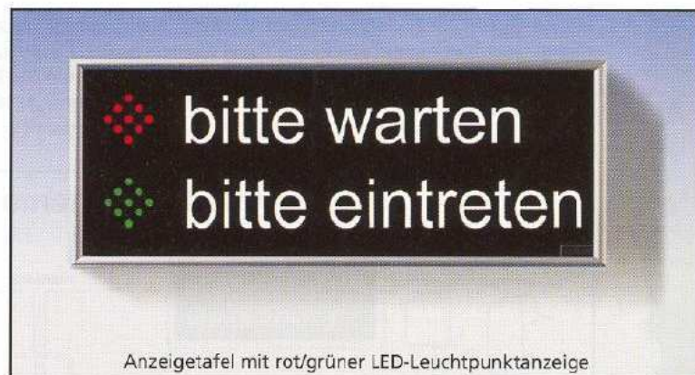
Anzeigetafel mit rot/grüner LED-Leuchtpunktanzeige

Einfaches, übersichtliches, leicht verständ- liches System (auch für nicht deutsch- sprachige Mitbürger)